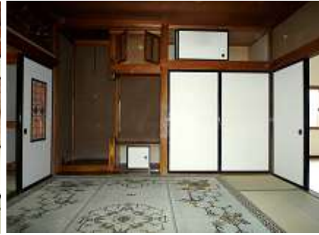
1階 二間続きの和室