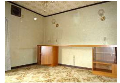
2階 洋室 8帖