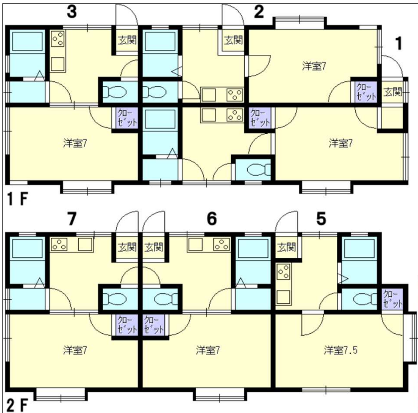
平面図 (数字は部屋番号)