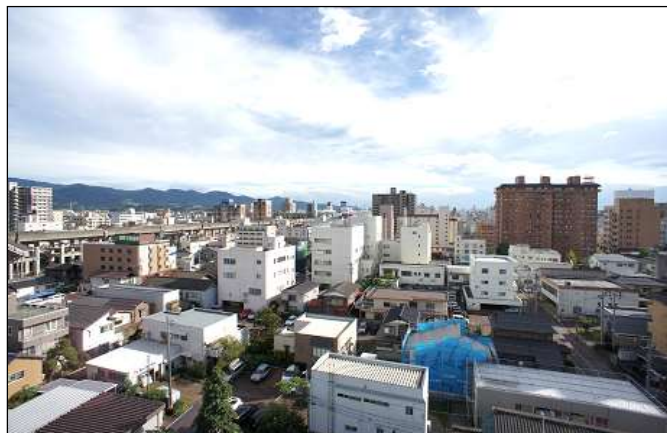
ベランダからの眺望 ~長岡花火も見えます~