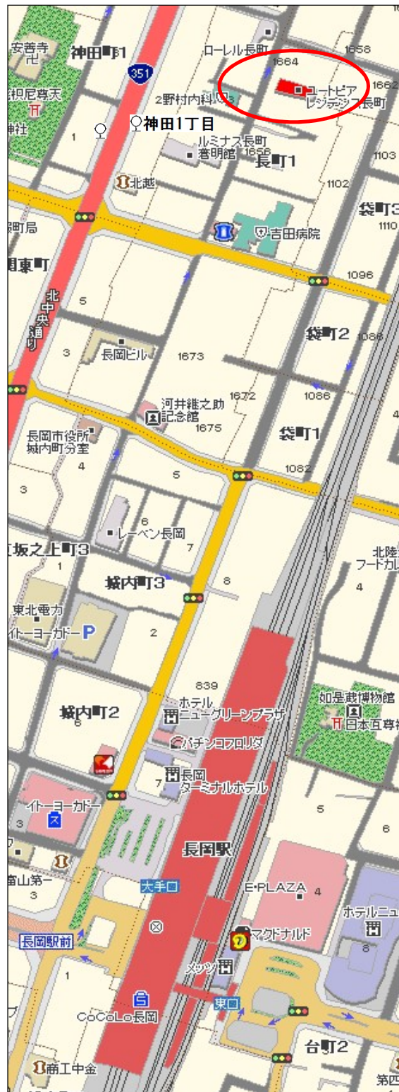
長岡駅から徒歩圏内