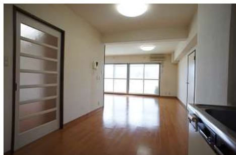
キッチンからリビングを見る