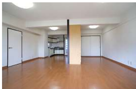
リビング窓際から室内を見る